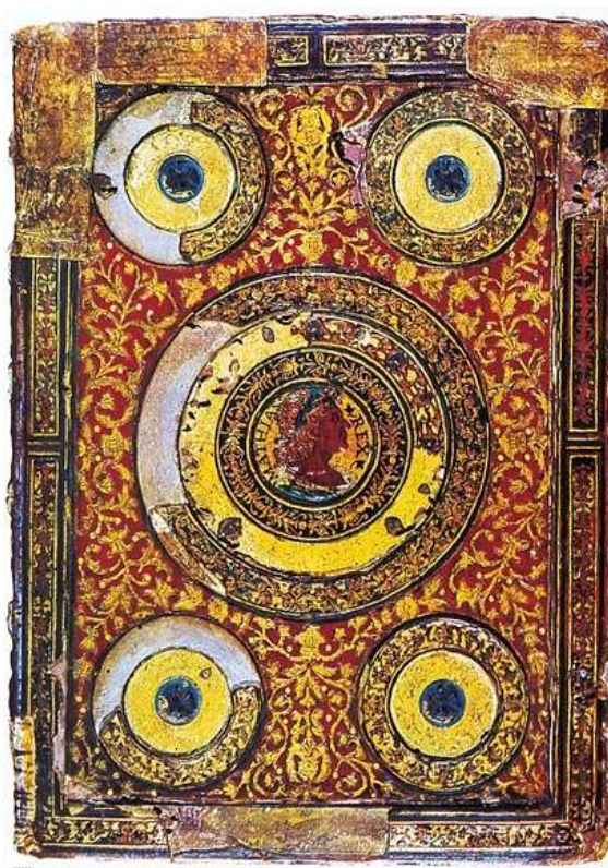
16. kép: Corvina kötéstábla egy imakönyv borítóján

A bőrkötések harmadik és legnagyobb csoportját a keleti és olasz motívumokat egyesítő sajátos stílus jellemzi, mely minden más könyvkötési stílustól elüt, és csupán Mátyás kéziratain fordul elő. Ez a tulajdonképpeni jellemző és tipikus Corvin-kötés. Valamennyit a díszítőelemek azonossága és a dús aranyozás jellemzi, amit Európában legelőbb éppen ezeken a kötésekön alkalmaztak ilyen nagy mértékben.