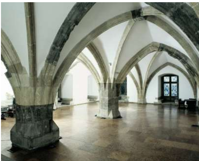
5. kép: Lovagterem a budai várban

A legnagyobb építkezésekre természetsszerűleg székhelyén, a budai királyi palotában került sor. Ezek hozzávetőleg 1479-ben kezdődtek, s a király haláláig sem fejeződtek be teljesen. Jelen ismereteink szerint Mátyás 3 nagyobb szabású épületegyüttessel egészítette ki az Anjouk gótikus budavári palotáját, amelyen egyébként a XV. század elején már Zsigmond király is eszközölt átalakításokat. Két új palotarészek közül az egyik a „befejezetlen palota” 40-50 méter hosszú és mintegy 15 méter széles volt, a másik nagyságára jellemző, hogy legalább 3 oldalról ölelte körül a „reneszánsz udvart”. Mátyás budai építkezéseiről történetírója, Antonio Bonfini készített közel egykorú „leltár”, s az átalakított budai vár bemutatásakor az ő jegyzeteinél nem kell jobb „idegenvezetőre” támaszkodnunk, leírásának köszönhetően szinte magunk előtt láthatjuk az évszázadok ködéből kibontakozó egykori pompás épületegyüttest: