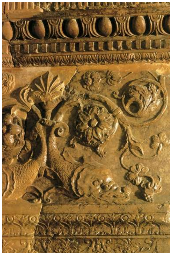
10. kép: Delfines fríz márványtöredék a budai palotából

hetvenes években – egyre nagyobb szerephez jutott a reneszánsz dekoratív szobrászat. Az oszlopfőkön, frízeken, pilasztereken bőséges alkalom nyílt ornamentális vagy figurális díszre.