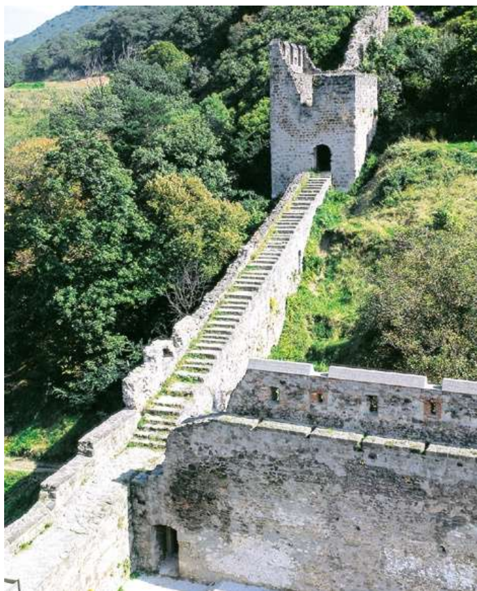
6. kép: A visegrádi alsóvár falának maradványa

Az udvar belső oldalán, a hegy lábánál, mely kissé magasabban fekszik, áll egy pompás kápolna, mozaikberakás borítja, miként a nagyrészt a többi szobát is, van benne egy drága zeneszerszám, melyet a köznyelv orgonának nevez, néhány ezüstsíp díszíti, ezenkívül az Úr testének szentségtartója és három oltárt, domborművekkel és képekkel, melyeket a legtisztább aranyozott alabástromból készítettek. Innen kelet felé ágba nyúlnak a király remekbe készült, aranymennyezetes termei. Az egyik úton a hosszú palotába lehet jutni, efelett a hegy magasodik, a másikon lehet menni tovább a lentebb fekvő szobákhoz. A kis udvar közepén itt is forráskút emelkedik alabástromból, fedett márvány oszlopcsarnok köríti, ez védelmet nyújt a lángoló nyári napsütés ellen. Ezután a szobák észak felé fordulnak, végül nyugat felé térnek vissza. Ablakuk mindenünnen a széles mederben folyó Dunára nyílik, s ez a kitekintőnek nagy szépséget mutat, különösen, hogy a Duna túlsó partján elterülő vidéken látható a német telepések által lakott Nagymaros mező város is felette messzire nyúló, nem túl magas hegy emelkedik s szőlőkkel végig bevan ültetve. Ezt a királyi palotát pompás fekvése mellett olyan drága épületek díszítik, hogy vitathatatlanul úgy tűnhet, sok királyság épületeit felülmúlja. 33