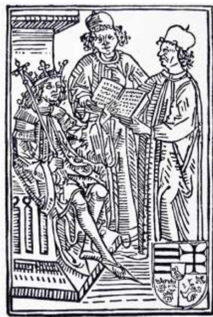
2. kép: Mátyás törvénykönyvének címlapja

királyi bevétel alól ugyanis rengetegen szereztek mentességet, ami által kivonták magukat az adózás alól. A reformmal Mátyás ezeket a jövedelmeket új névvel léptette életbe, ami alól senkinek sem volt mentessége. Így a királyi kincstár adója és a koronavám az eddigi jövedelmeket megsokszorozta. (Erdélyben emiatt összeesküvést is szerveztek Mátyás ellen, amit ő kemény kézzel fölszámolt.) A reformhoz tartozott az is, hogy a jövedelmek központi kezelője a kincstartó lett, aki nem előkelő személyiség volt, hanem egy udvari hivatal vezetője. Maga is szakember volt, és a hivatalban is nagyrészt köznemesi származású szakképzett emberek dolgoztak. Mivel fizetett alkalmazottak voltak, a király akaratának mindenben engedelmeskedtek. A jövedelmek súlypontja azonban uralma alatt áthelyeződött a rendkívüli hadiadóra. Először a korona visszaszerzésének fedezésére rendelte el az országgyűlés beleegyezésével a telkenként 1 aranyforintnyi rendkívüli adót. Később ezt honvédelmi célokra szedette be, majd ötévenként előre megszavaztatta, sőt időnként az országgyűlés megkérdése nélkül is beszedte. Pénzjövedelmei így rendkívüli módon megnövekedtek, ez tette lehetővé, hogy állandó fizetett zsoldoshadsereget tudott tartani, és hogy a hivatalnokok szintén fizetett alkalmazottakká váltak.