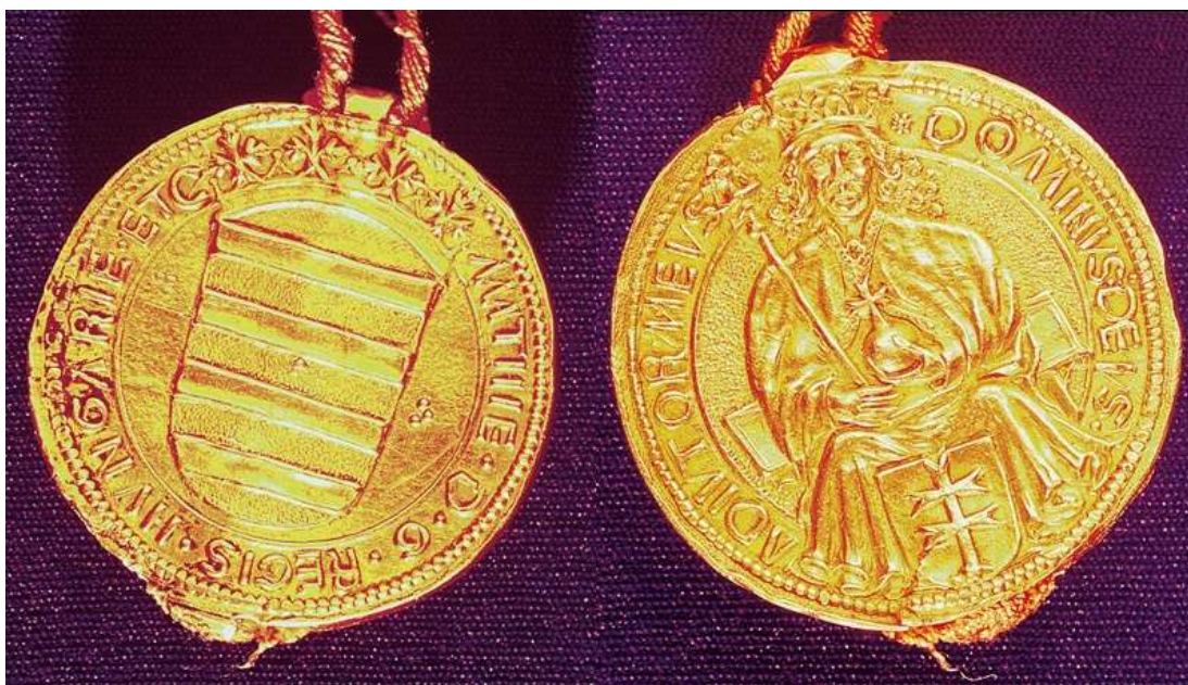
7. kép: Mátyás aranybullája

A koronázás alkalmával, 1464-ben vésék Mátyás nagy kettős pecsétjét, melyet a király később is, mindvégig használt. Az előlapon Mátyás koronás, trónoló alakja tűnik fel, körülvéve hatalmi jelvényeivel, országának, tartományainak, családjának címereivel.