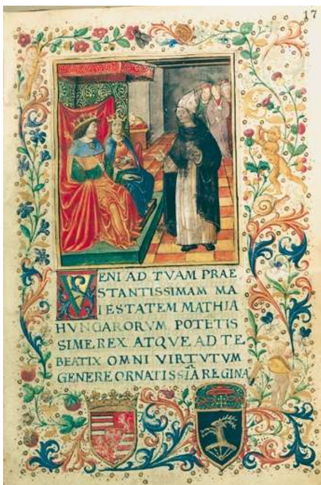
4. kép: Mátyás és Beatrix

ágyazva tárgyalta, és sok ókori forrásból merített. A magyar múltról szóló ismeretek a XIX. századig főképp Bonfini művéből származtak, itthon és külföldön egyaránt. Népszerűségben Bonfiniéval vetélkedett Galeotto Marzio Mátyásról szóló könyvecskéje, amelyben a szerző anekdotaszerű kis történetekben örökítette meg élményeit a királyról és családjáról, a magyar szokásokról és műveltségéről, magyar barátairól. Az utóbbiak közül Bátori Miklósról emlékezik meg a legmelegebben. 24