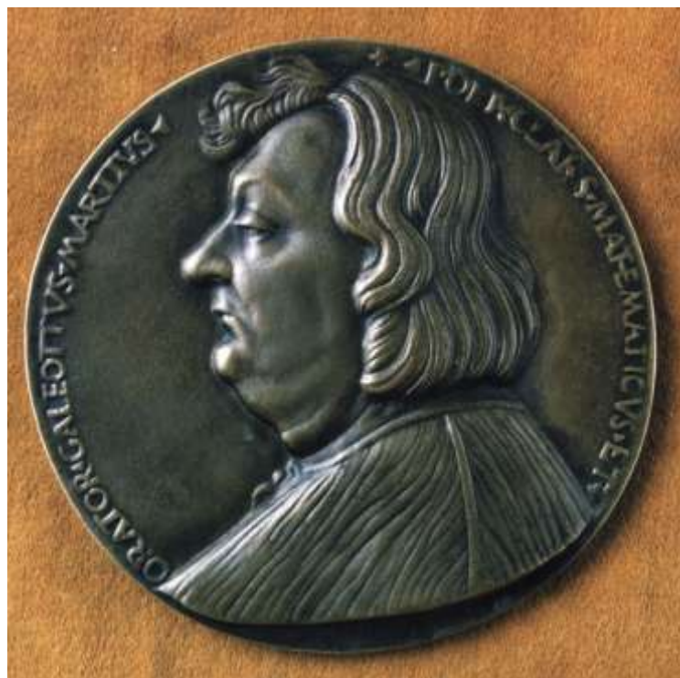
13. kép: Galeotto Marzio

Az esküvői szertartást karácsony előtti vasárnapon, december 22-én a budai Nagyboldogasszonytemplomban tartották, amit természetesen újra lakoma követett. Ezzel a lakodalom véget ért, a vendégek azonban vízkeresztig (január 6.) együtt maradtak. Az eseményekről részletes tudósítást író boroszlói jegyző nem mulasztotta el feljegyezni, hogy: „hazatértekor senkit sem bocsátottak el ajándék nélkül.” 62