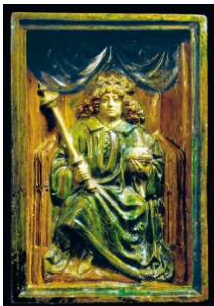
9. kép: Mátyás királyt ábrázoló kályhacsempe

Padlócsempék, tetőcserepek gyártása csak kicsiny részlet Mátyás udvarának nagy művészi tevékenységében. Mégis visszatükröződik benne a szépség, a színesség keresése, az újítások friss megragadása. Éppen ezért válhatott hatóerővé, mely kisugárzott a központtól a vidékre, mind a király építkezéseire, mind pedig a főpapi székhelyekre.