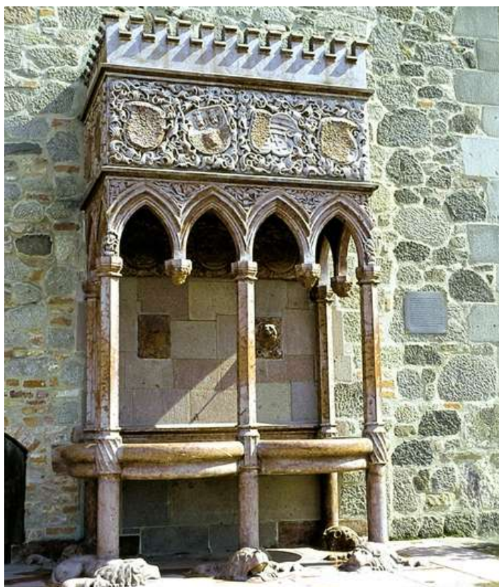
11. kép: Mátyás király oroszlános szökőkútja Visegrádon

A budai királyi palota a nagyszabású bronzszobrokon kívül – ismét a reneszánsz szokásainak megfelelően – bőségesen el volt látva szökőkutakkal, vízmedencékkel. A kert fehér márványból és ezüstből készült kettős kútját, úgyszintén a kőből faragott nyolcszögletű gótikus kutat Mátyás és Beatrix címerével az ásatások hozták napfényre a palotától délkeletre a jelenlegi kertben, a várfalak sarkában. Az előudvarban – vagy a Friss-palota udvarán – hatszöves nagy szökőkút állott, melyből nagy ünnepélyek alkalmával bor csörgedezett. A belső udvarban kisebb, valószínűleg falikútszerű vízmedence volt elhelyezve. Ugyanitt az oszlopos árkádok előtt, a kápolna bejáratával szemben emelkedett a díszes Pallas-kút, vagy magyarosan a „csatornakút”. Csaknem teljesen épen maradt fenn egy vörösmárvány falikút, melyet egyszerű, sima reneszánsz keret és két erőteljesen mintázott oroszlánfej díszít. Végül tudunk még egy fehér márvány szökőkútról, melyet nem kisebb mester, mint Verrocchio faragott Firenzében a magyar királynak, és Poliziano írt róla magasztaló epigrammákat. 55