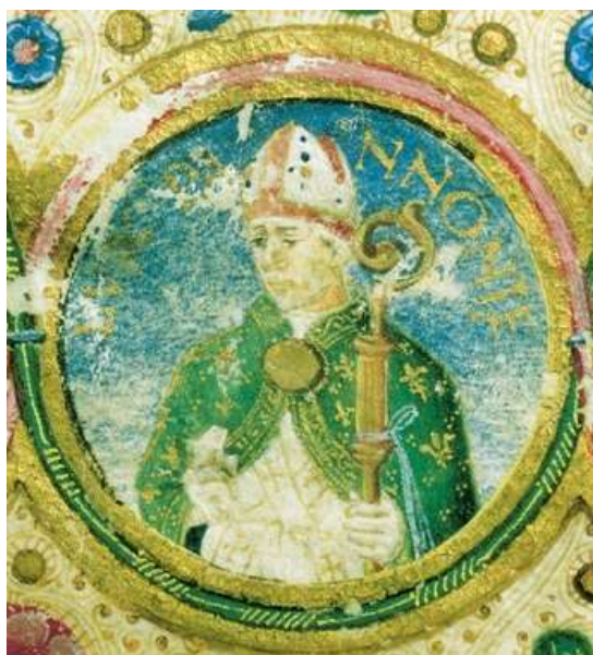
3. kép: Vitéz János képe a Tribachus-kódexből

A 15. századi Itáliában fénykorát élte a reneszánsz művészet, az Alpoktól északra fekvő országokban azonban jószerevel még csak hírből ismerték. Az új stílus elsők között Mátyás király Magyarországon kezdte meg hódító útját az 1470-es években. Szálláscsinálói az új típusú műveltségisményét írásaikkal képviselő humanisták voltak, akik a világi és egyházi fejedelmek szolgálatába állva a XV. században Európa minden valamirevaló udvarában megjelentek. Hazánkban a XV. század annak ellenére, hogy a politikai életben számottevő nehézség mutatkozott, a gazdaságban és a társadalom életében igen nagy fellendülést jelentetett. Magyarország az Anjouk által kijelölt úton haladt az európai polgárosodás modelljét követte mind Zsigmond, mind a Hunyadiak alatt.