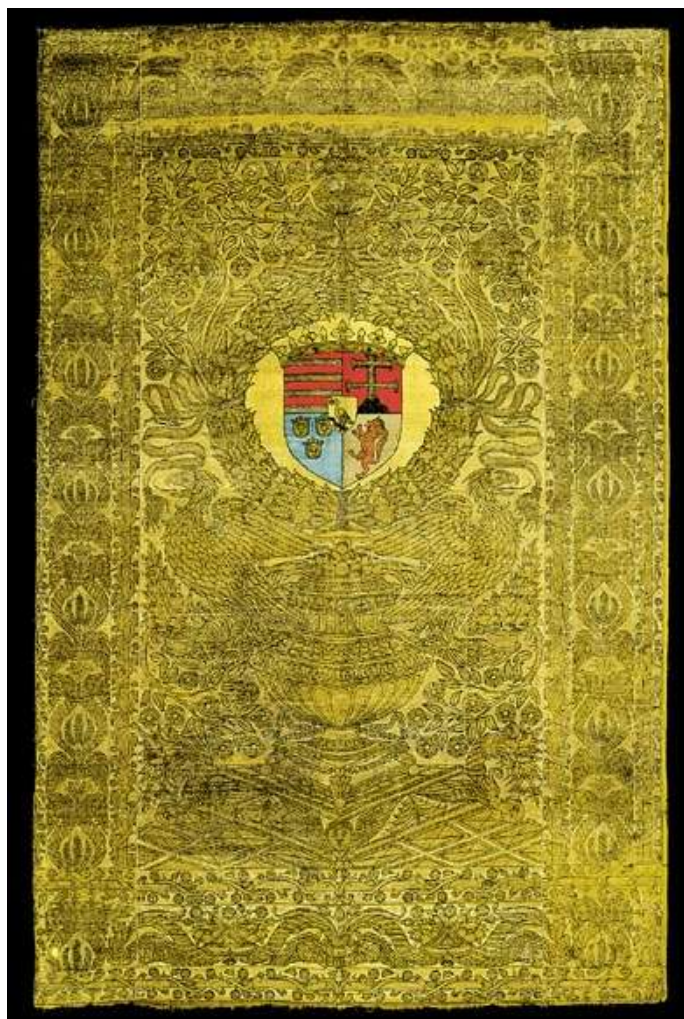
8. kép: Mátyás király trónkárpitja

A bútorokon megtaláljuk a szövőművészet remekeit. A berendezés legfontosabb bútordarabjait, a padszékeket szőnyegekkel, kárpitokkal tették puhává, kényelmessé. A könyvtárszobában a király heverőjét és a háromlábú székeket aranyos takarók fedték. A könyvespolcokat aranyos függönyök védték a portól. A beléjük szőtt feliratok a diszciplínákat nevezték meg, tehát a szakszerű rendezés elveit is szolgálták.