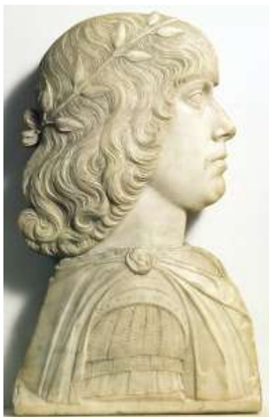
1. kép: Mátyás fiatalkori portréja

1442 tavaszán Hunyadi János erdélyi vajda az általa kormányzott tartományában tartózkodott. Május 28-án például Szászhermányból keltezett egy levelet. Minden jel szerint vele volt felesége, Szilágyi Erzsébet is, aki 1443. február 23-án Kolozsvárott megszülte második fiát, Mátyást. A másodszületett fiú gyermekkorát elsősorban anyja felügyelete alatt töltötte, mivel apját a háborúk, majd az ország kormányzata foglalta le. A középkori arisztokráciánál ez nem volt szokatlan: mialatt a családfő az uralkodó udvarában vagy a csatamezőn biztosítja családja befolyását, felesége otthon marad, igazgatja a birtokaikat, és neveli a gyermekeket.