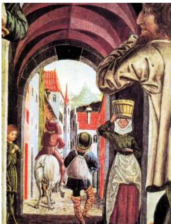
12. kép: Középkori utcarészlet táblakép töredéken (1470 körül)

Mátyás uralkodása alatt a festőcéhek országszerte virágzottak, szervezetük már kiformalódott, sőt a festők mesterremekére nézve is határozott szabály alakult ki. Seybold 1476-ban Budán is találkozott egy festővel, nyilván a helybeli céh valamelyik tagjával, és egy festőinással, de nevüket nem jegyezte meg. A szerzetesek is buzgón művelték a festészetet. Mátyás mind a céhbelieknek, mind pedig kedvelt pálosainak adhatott megbízást vallásos képekre. A budai várkapolnát – Bonfini szerint – számos képpel ajándékozta meg. Közülük nem hiányozhatott Alamizsnás Szent János képe sem, akinek az ereklyéjét Mátyás nagy ünnepélyességgel helyezte el éppen a várkapolnában. A festmények egy része hazai mester munkája lehetett. A török elől Pozsonyba menekített királyi kincsek között is volt egynéhány értékes kép, hordozható oltár, aranyozott ezüst foglalatban. Közülük egyik vagy másik még Mátyás kincseiből származhatott.